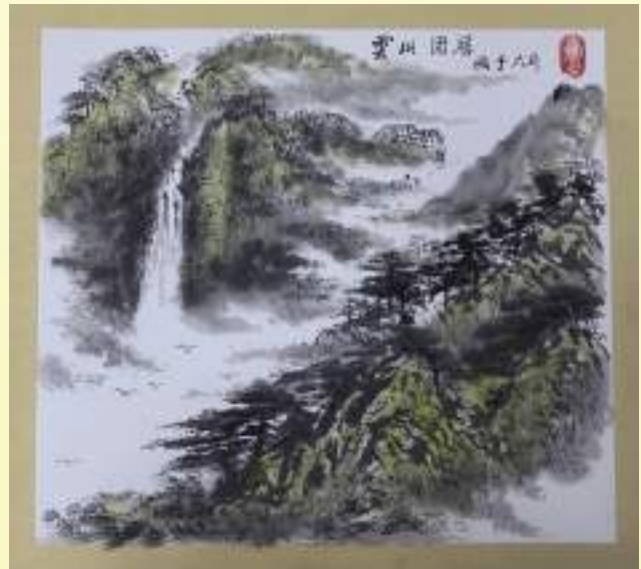
孔宪玉《云山固居》绘画类第三名